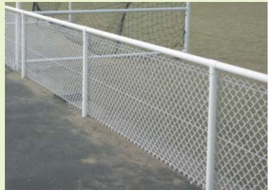
3. Main courante avec remplissage simple torsion