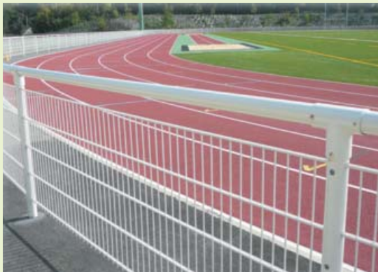
2. Main courante avec remplissage treillis soudé