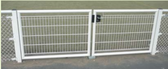
Portillons et portails assortis