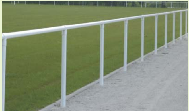
1. Main courante sans remplissage